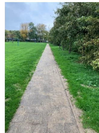
Jan van Goyenlaan