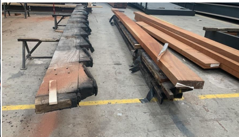
Schade van de constructie