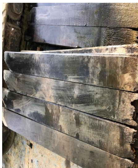
Hergebruik van damwandplanken

In 2022 is overige 350 meter damwand langs het sportpark IJsseloever vervangen. De uitgekomen damwandplanken zijn hergebruikt in de stadgracht en de uitgekomen damwandplanken van de stadgracht zijn weer hergebruikt voor de vervanging van de beschoeiing in de stadsvijver. Daarnaast is de betonnen beschoeiing aan de Groenedijk vervangen door houten damwandplanken.