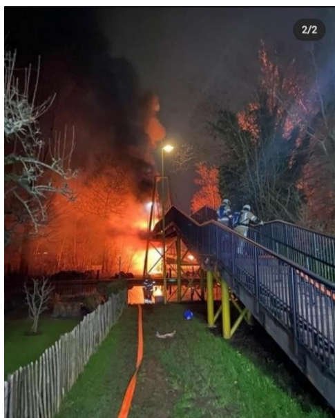
Brand van de fiets/ voetgangersbrug

Activiteiten 2022 Door vandalisme is de fiets/voetgangersbrug over de gekanaliseerde Hollandse IJssel in de brand gestoken. We hebben een onderzoek laten uitvoeren om te beoordelen of de brug vervangen moest worden of kon worden hersteld. De brug hebben we kunnen herstellen.