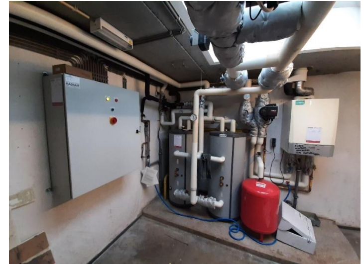
Sint Petersburglaan 27, Verduurzamen installatie