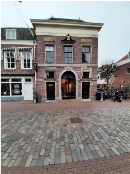
Benschopperstraat 39, 41, 41a