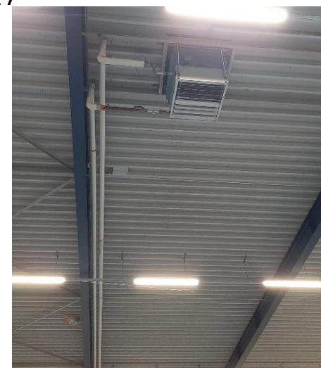
Heemradenlaan 38, sporthal 't Heem