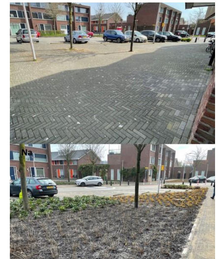
Afbeelding: Parklaan voor- en na situatie