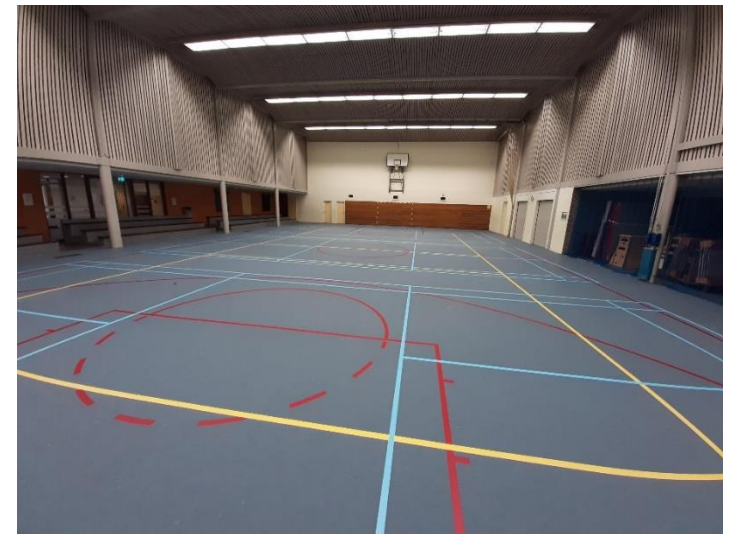
Poortdijk 34, sporthal Poortdijk