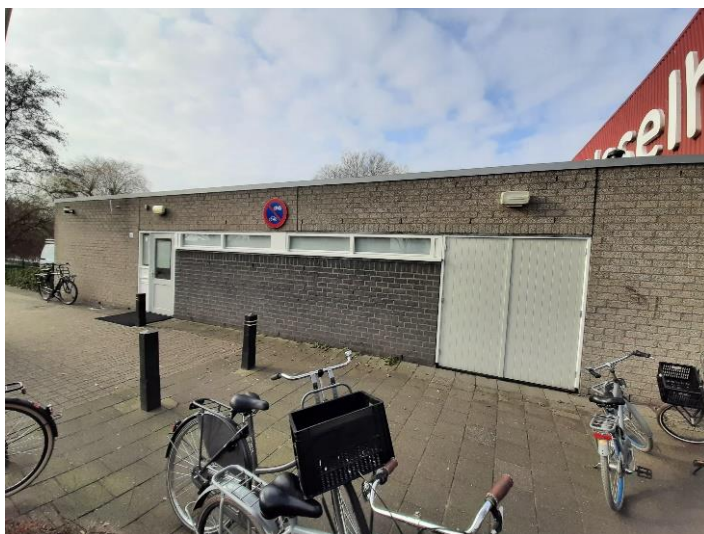
Oranje Nassaulaan 50, sporthal IJssel